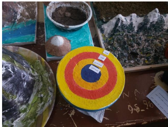
شکل ۴- استفاده از ماکت برای تدریس

مثال: استفاده از علائم اختصاری مانند L (کم فشار) و H (پر فشار)، استفاده از فلش و خطوط برای نمایش گردش عمومی هوا ماکت: نمایش فرایندها، مفاهیم و پدیده‌ها بر روی ماکت (شکل شماره ۴)